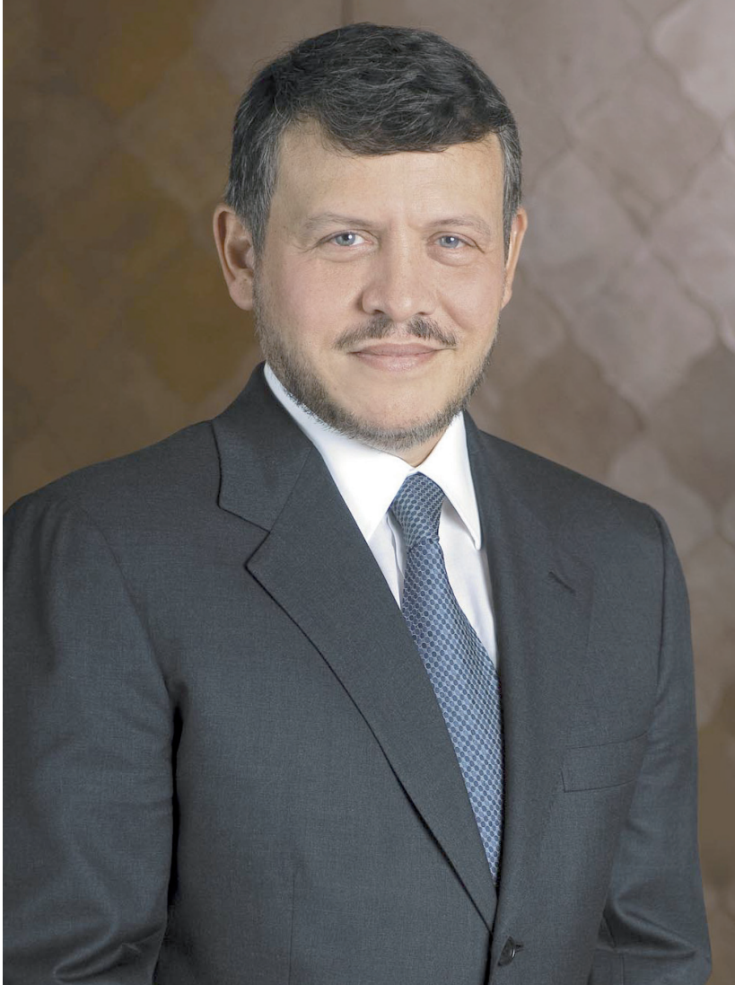
حضرة صاحب الجلالة الهاشمية الملك عبدالله الثاني ابن الحسين المعظم